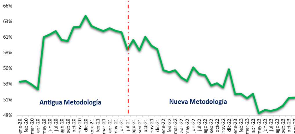
Gráfico Nro. 1: Evolución del indicador de la Deuda Pública / PIB